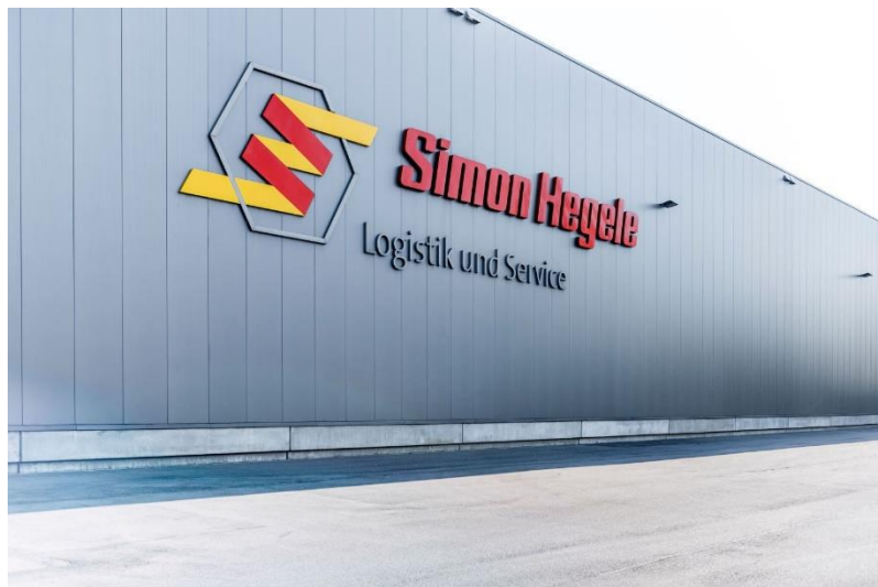
Bild1: Der Logistikspezialist verfolgte von Beginn an das Ziel, den Aufwand für die Leistungserfassung und Rechnungsstellung für seine Kunden deutlich zu reduzieren. Mit EPG | CnB hat der Kontraktlogistiker eine digitale Lösung gefunden, die diese Zielerreichung unterstützt.